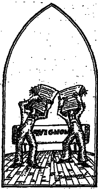
(Dessin de Bonnaiffé.)